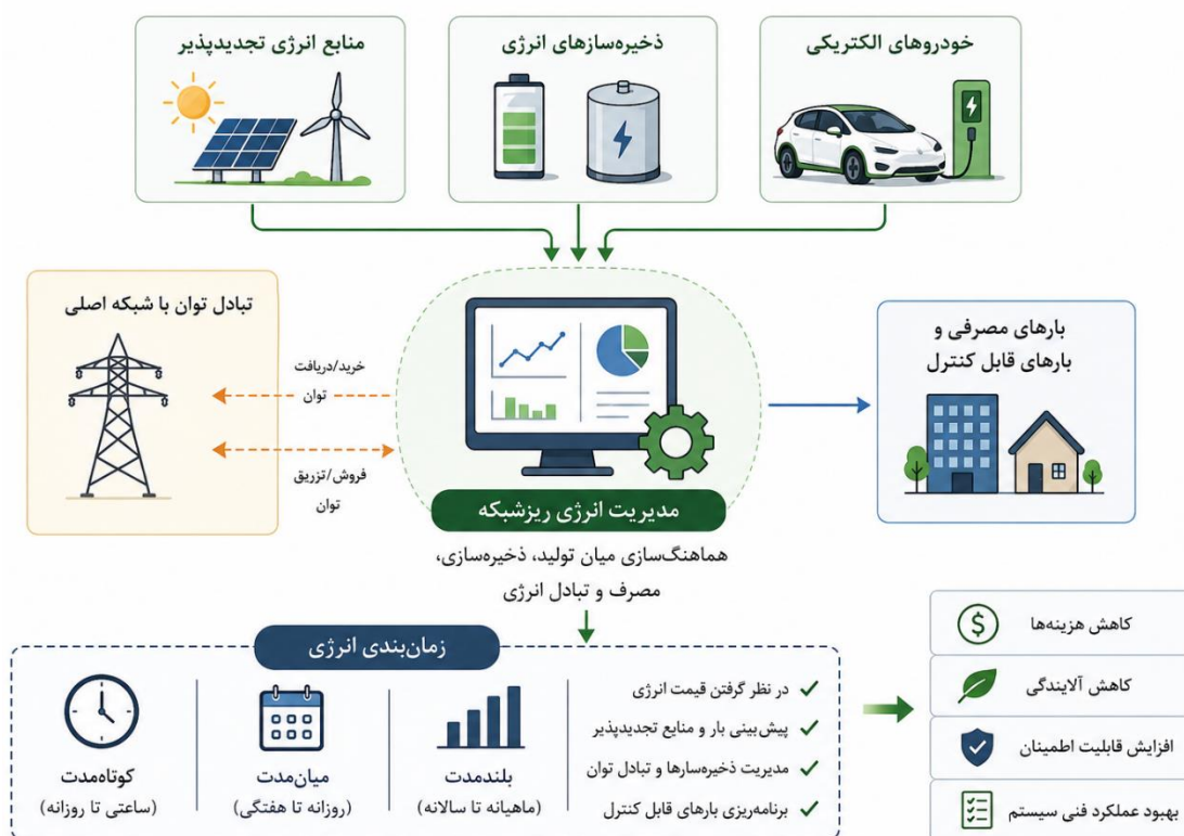
شکل (۲): اهمیت مدیریت انرژی در ریزشبکه