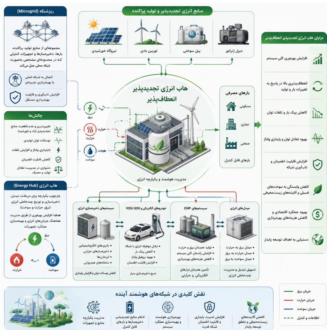
شکل (۱): مدیریت انرژی ریزشکده در حضور هاب‌های انرژی تجدیدپذیر انعطاف‌پذیر Figure 1: Microgrid energy management with flexible renewable energy hubs

دو طرفه انرژی میان خودروها و شبکه را فراهم می‌کنند [۱۲]. در این شرایط، خودروهای الکتریکی می‌توانند علاوه بر مصرف‌کننده انرژی، به‌عنوان منابع ذخیره‌سازی سیار نیز عمل کرده و در کاهش پیک بار، بهبود پروفیل ولتاژ و افزایش قابلیت اطمینان شبکه نقش مؤثری ایفا کنند [۶ و ۱۲]. از سوی دیگر، سیستم‌های تولید همزمان برق و حرارت (CHP) نیز سهم قابل توجهی در افزایش بازدهی هاب‌های انرژی دارند. این سیستم‌ها با تولید هم‌زمان انرژی الکتریکی و حرارتی از یک منبع سوخت، موجب افزایش راندمان کلی سیستم و کاهش هزینه‌های بهره‌برداری می‌شوند. ترکیب CHP با منابع تجدیدپذیر و ذخیره‌سازهای انرژی، امکان ایجاد ساختارهای چندحاملی با راندمان بالا را فراهم می‌کند که قادر به تأمین هم‌زمان نیازهای الکتریکی و حرارتی مصرف‌کنندگان هستند [۱۳]. در مجموع، هاب‌های انرژی تجدیدپذیر انعطاف‌پذیر به‌عنوان یکی از مهم‌ترین زیرساخت‌های شبکه‌های هوشمند آینده، قابلیت ایجاد تحول در نحوه مدیریت و بهره‌برداری سیستم‌های انرژی را دارا هستند. این ساختارها با فراهم کردن مدیریت یکپارچه منابع، ذخیره‌سازها، خودروهای الکتریکی و بارهای قابل کنترل، می‌توانند نقش مهمی در دستیابی به اهداف توسعه پایدار، کاهش آلاینده‌های زیست‌محیطی و افزایش امنیت و قابلیت اطمینان شبکه‌های قدرت ایفا کنند.