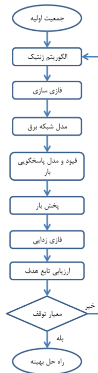
شکل (۱): فلوچارت چارچوب پیشنهادی برای بهینه‌سازی عملکرد شبکه توزیع با در نظر گرفتن پاسخگویی به تقاضا، منابع انرژی تجدیدپذیر، باتری، خودروهای الکتریکی، OLTC و تنظیم‌کننده‌های ولتاژ با استفاده از الگوریتم فازی-ژنتیک Figure (1): Flowchart of the proposed framework for optimizing distribution network performance, considering demand response, renewable energy resources, batteries, electric vehicles, OLTC, and voltage regulators using a fuzzy-genetic algorithm.

به‌روز شده و در ارزیابی برازندگی تأثیر داده می‌شوند. در نهایت، پس از رسیدن به معیار توقف الگوریتم، جواب‌های بهینه شامل پروفایل توان تجهیزات، وضعیت کلیدزنی شبکه، ولتاژ شین‌ها و میزان تلفات و هزینه بهره‌برداری به دست می‌آیند. این خروجی‌ها قابلیت تحلیل، مقایسه و تصمیم‌گیری برای اپراتور شبکه را فراهم می‌سازند. چارچوب پیشنهادی ارائه شده در این فلوچارت به گونه‌ای طراحی شده است که می‌تواند به راحتی برای انواع دیگر از شبکه‌های توزیع، شرایط مختلف بهره‌برداری و سیاست‌های کنترلی توسعه یابد. این ساختار همچنین از انعطاف‌پذیری بالایی برای ترکیب روش‌های بهینه‌سازی دیگر و تحلیل سناریوهای مختلف برخوردار است.