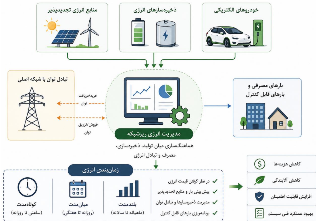
شکل (۲): اهمیت مدیریت انرژی در ریزشبکه